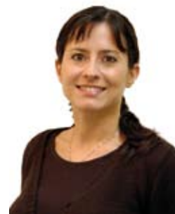
di Federica Boccaletti

D opo la decisione della maggioranza Consiliare di Novi di procedere alla privatizzazione di Aimag (con voto contrario dell'opposizione, di Rifondazione e astensione dei Verdi), mediante vendita di una parte delle azioni, si è costituito un comitato promotore per l'indizione di un referendum.