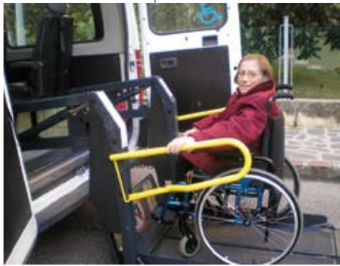
Il servizio di trasporto del CSA di Rovereto