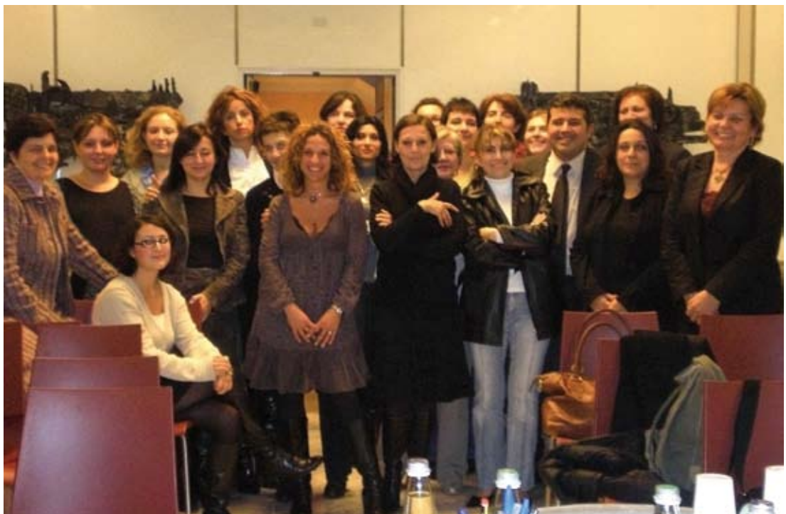
La Commissione Pari Opportunità

Ai primi di novembre si terrà la prima riunione di questo organismo, al quale in base ad una convenzione firmata dai Comuni dell'Unione è stata trasferita la materia inerente la promozione delle Pari Opportunità: inoltre in questa sede si eleggerà la Presidente della Commissione stessa.