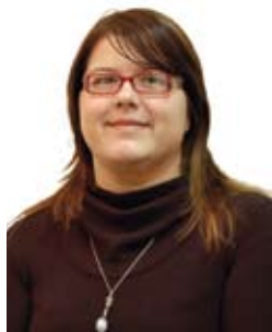
di Cristina Bertolini

È stato approvato proprio in questi giorni il Decreto Legge n. 137/08, meglio conosciuto come "legge Gelmini", che attua una serie di riforme all'interno del sistema scolastico.