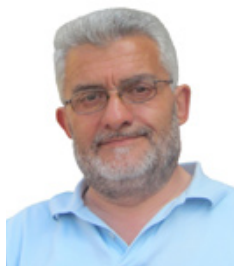
di Claudio Violi

B uongiorno a tutti, questo numero del giornalino esce in un momento per noi Novesi NON facile, cioè subito dopo la ricorrenza del terremoto del 29 Maggio 2012. La prima osservazione è che la giunta ha organizzato un ciclo di manifestazioni molto completa e per tutte le date... meno per il 29, già ma forse le 170 scosse di quel giorno (di cui 3 maggiori del 5°, 11 maggiori del 4° e 37 maggiori del 3.5° e per giunta un bel po' nel nostro territorio comunale) ORMAI DEVONO essere dimenticate, meglio ricordare quelle tra il 20 ed il 28 maggio.