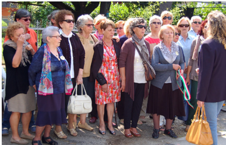
Il coro Mondine

«Il bello della musica è che non si ferma mai, nemmeno quando tutto sembra perduto. - Afferma il Sindaco Luisa Turci - È per questo motivo che inaugurare questa scuola è stata un'emozione fortissima, frutto non solo del lavoro tecnico e progettuale ma anche e soprattutto della cooperazione tra enti diversi, cittadini e artisti. Un grazie di cuore quindi a Cariparma, a Radiobruno ed a tutti coloro che, con la loro generosità, hanno contribuito al raggiungimento di questo importante traguardo».