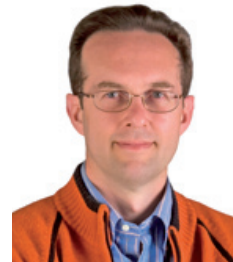
di Mauro Fabbri