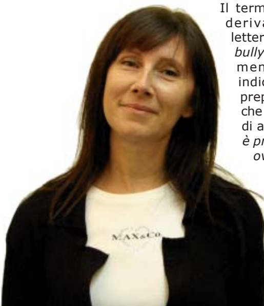
Vania Pederzoli Assessore all'Istruzione e alle Pari Opportunità

Non da ultimo, a breve, in ogni Comune, verrà organizzato un evento pubblico di presentazione dell'esito della ricerca allo scopo di informare, sensibilizzare e avviare quel confronto tra i soggetti della comunità educante fondamentale per raggiungere il comune obiettivo.