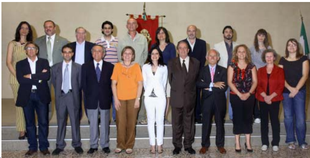
Il Consiglio Comunale