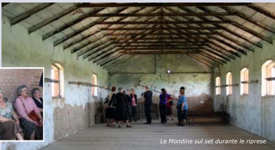
Le Mondine sul set durante le riprese

I l Coro Mondine di Novi è protagonista di un film documentario che racconterà, attraverso immagini, parole e note, la vita di risaia in un percorso storico a cavallo di due secoli ('800 e '900).