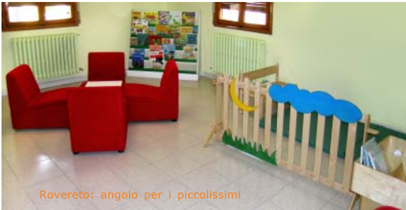
Rovereto: angolo per i piccolissimi

I l 2007 è stato un anno molto importante per le biblioteche di Novi e Rovereto. In risposta ad un continuo aumento dei prestiti e alla richiesta di nuovi servizi da parte dell'utenza, il Comune ha risposto con un piano di intervento volto ad ampliare e migliorare i servizi.