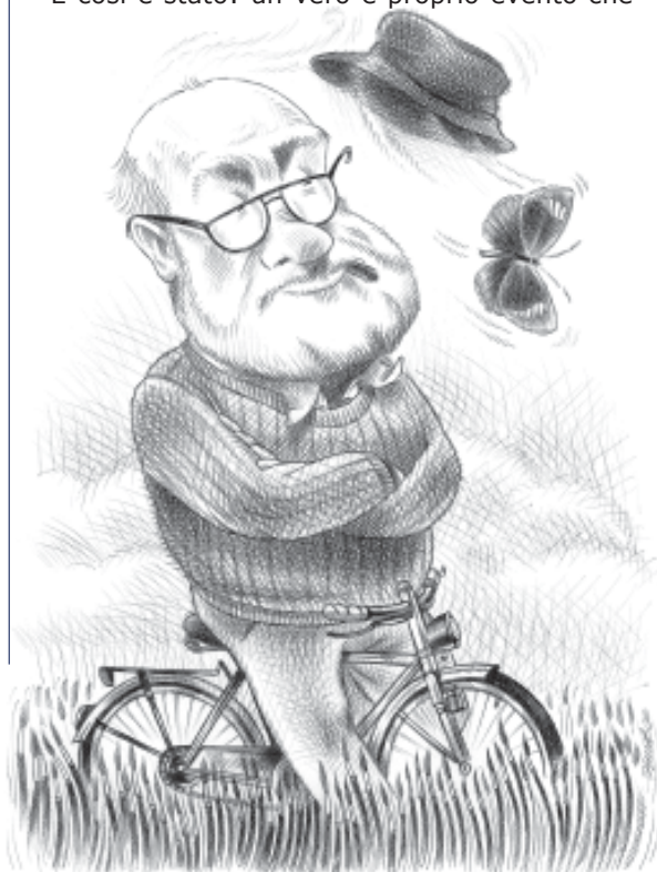
Adriano in un disegno di Stefano Amati

Non rimane quindi che attendere il prossimo 12 gennaio, chiudere per qualche istante gli occhi e immaginare di rivedersi ancora una volta insieme ad Adriano, magari intorno a un tavolo, mentre alcuni chiacchierano, Lui, con la penna in mano, intento a disegnare i suoi pensieri.