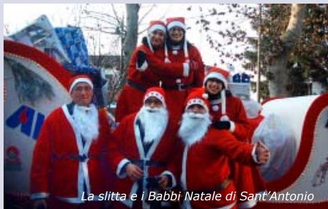
La slitta e i Babbi Natale di Sant'Antonio

Le renne voleranno tra le vie del paese fino alle 20.30 circa, ora prevista per l'arrivo in piazza Matteotti, dove l'Avis aspetterà grandi e piccini per offrire dolci, un caldo vin brulé e augurare a tutti buone feste.